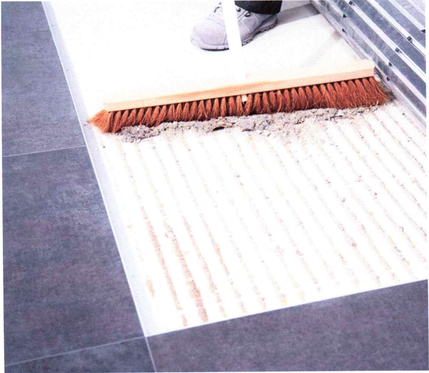
Abb.2: wöchentliche Zwischenreinigung