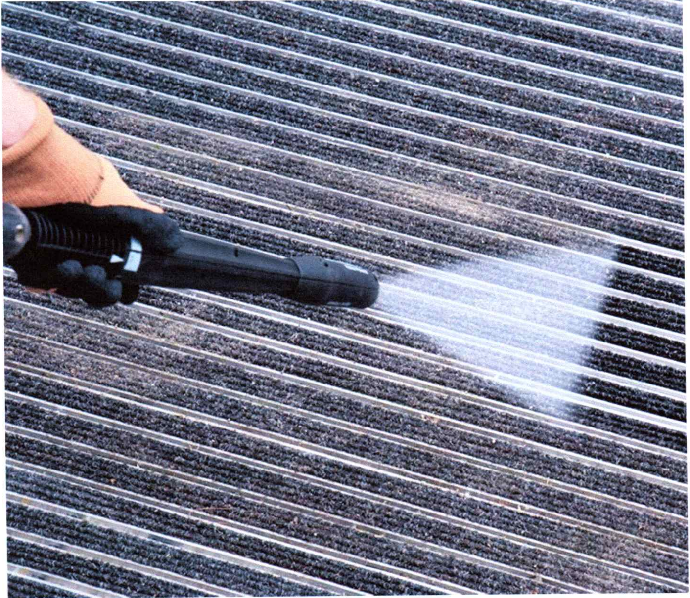
Abb.3: monatliche Grundreinigung